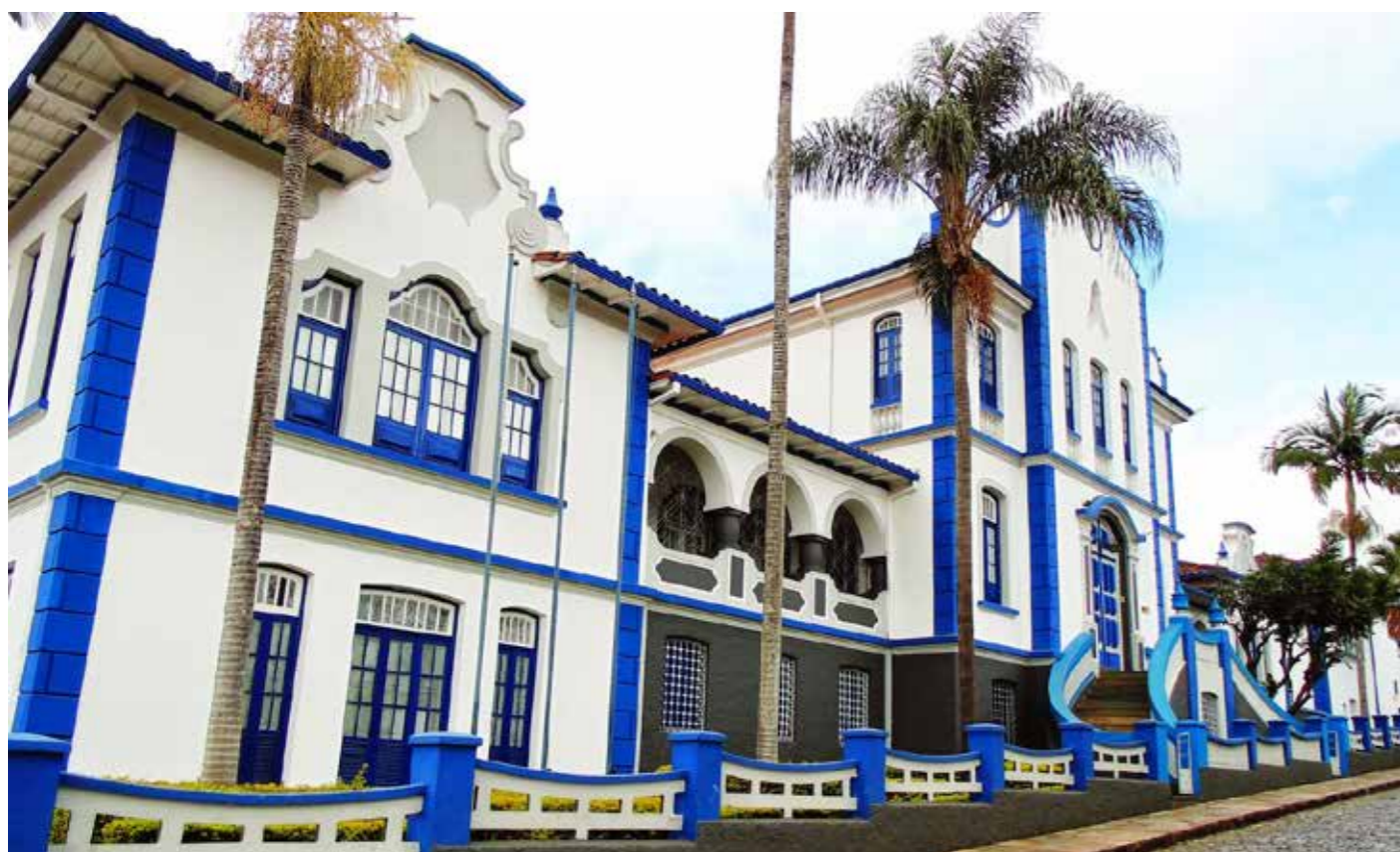
Colégio Providência de Mariana-MG - 1ª escola feminina de Minas Gerais, foi fundada pelas Filhas da Caridade francesas em 10 de março de 1850.